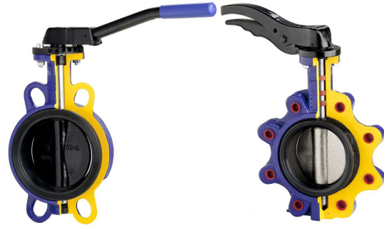
Fig. 497 (WAFER-Typ)